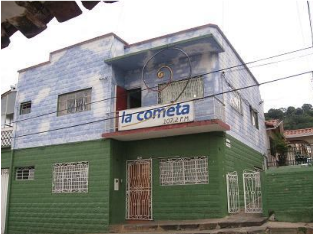
Estructura Física de La cometa – octubre 2008 - San Gil