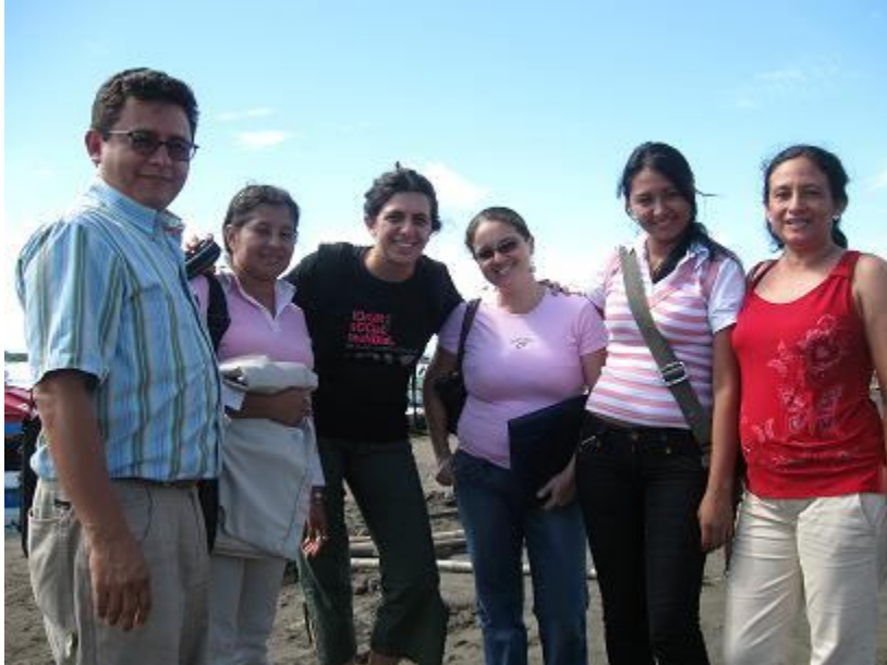
Reunión de Radio Ciudadanas en Barrancabermeja