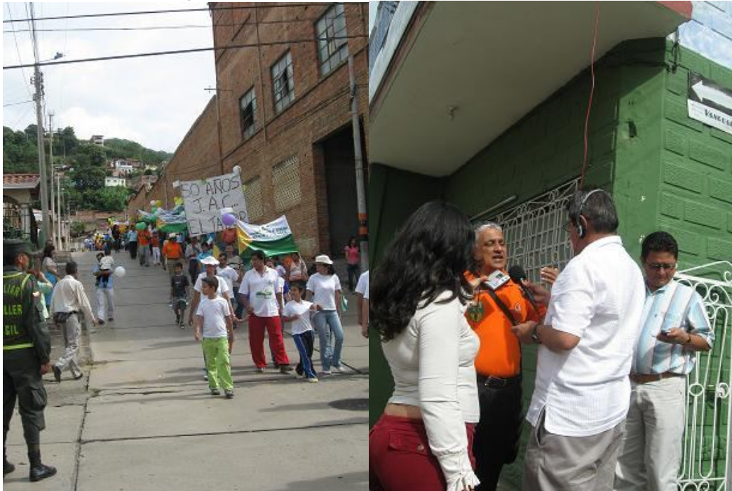
Marcha por los 50 años de Juntas Locales