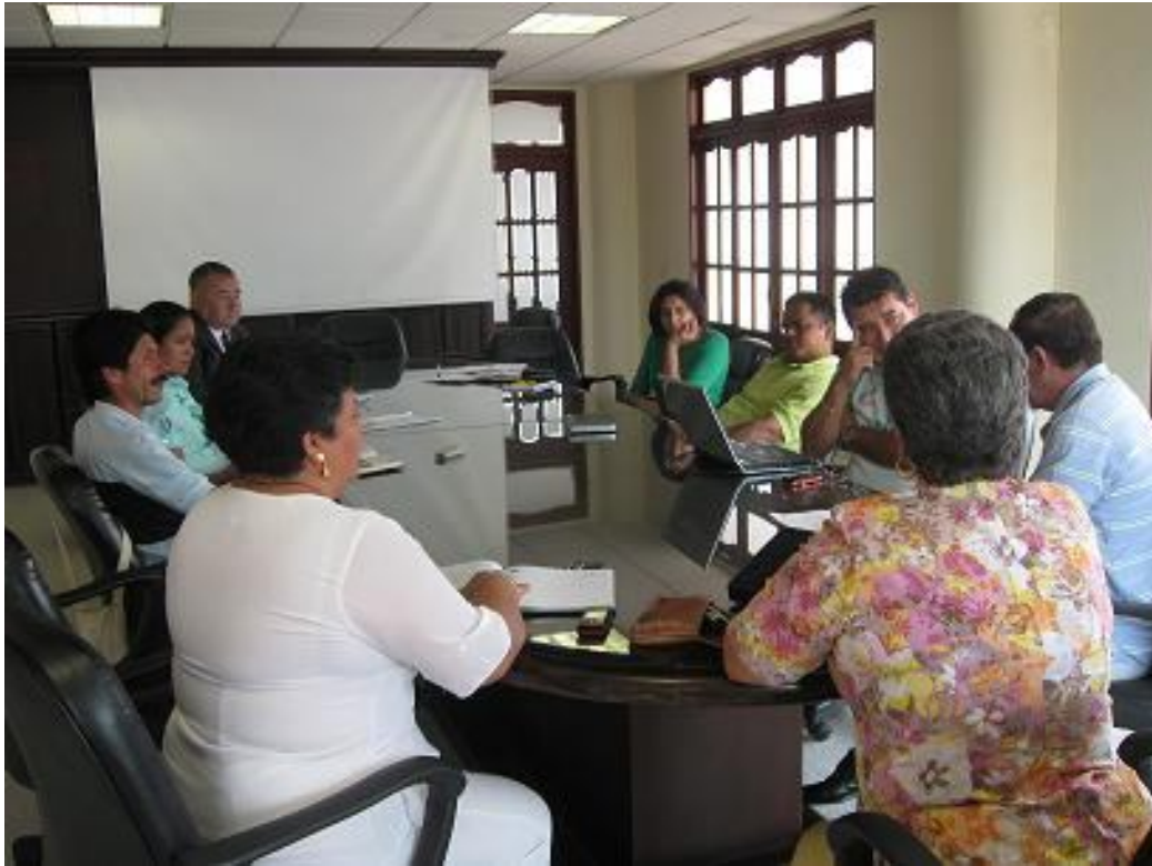
Red Solidaria reunida en Coopcentral