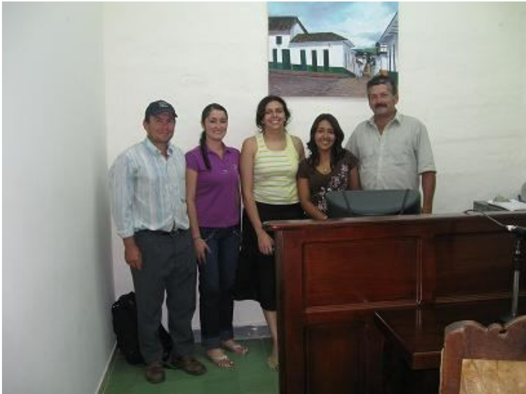
Integrantes de la Radio de Barichara